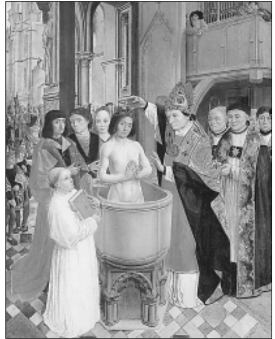
КАТОЛИЧЕСКАЯ ЦЕРКОВЬ. Слева: Св. Августин с книгой «О Граде Божиим». Миниатюра 2-й пол. XV в. Королевская библиотека, Брюссель; справа: Мастер св. Жюля. Крещение Хлодвига. Ок. 1500. Нац. галерея, Вашингтон

признана т.н. Формула Гормизда — краткое изложение веры, составленное Папой →Гормиздом.