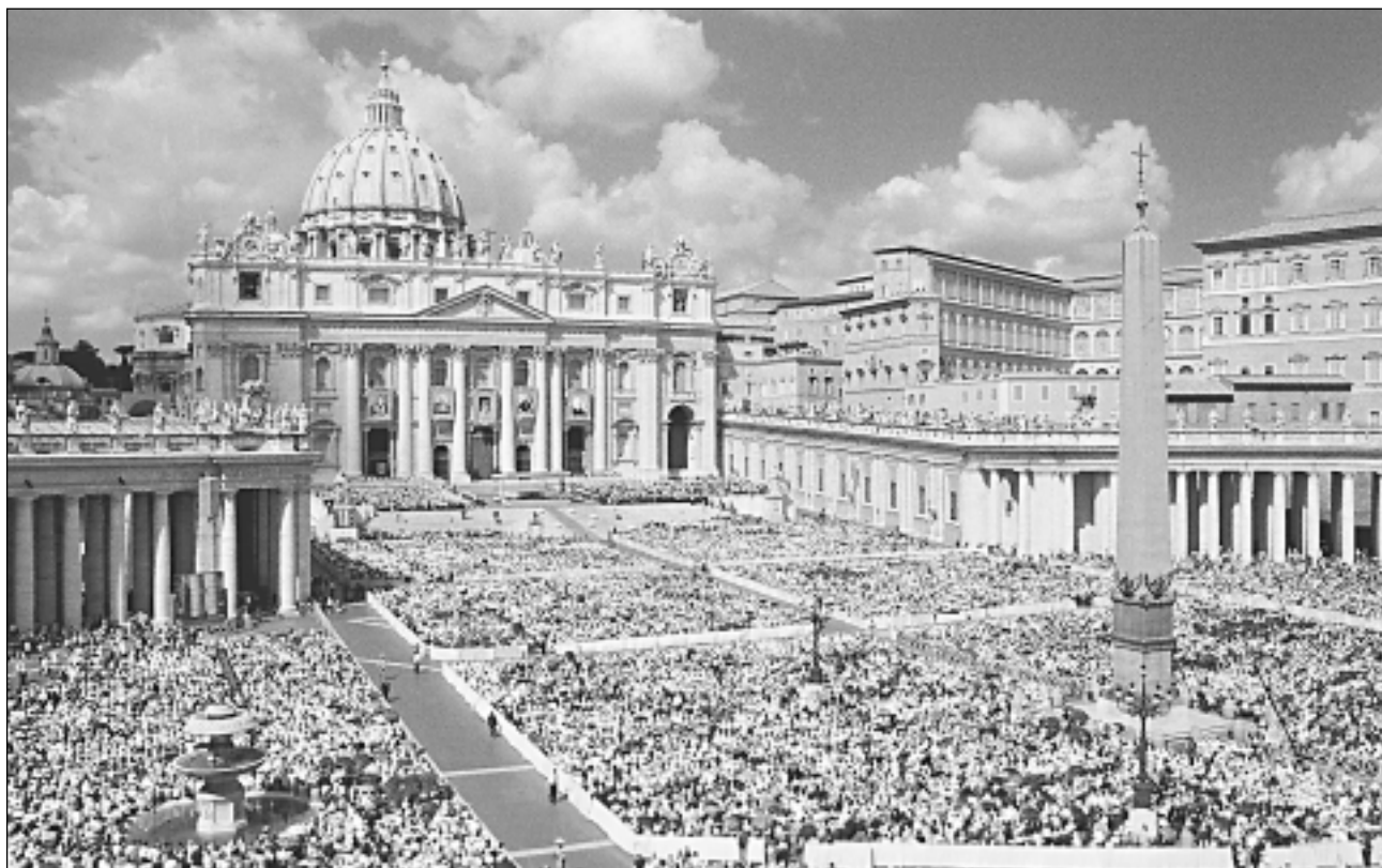
КАТОЛИЧЕСКАЯ ЦЕРКОВЬ. Беатификация Римских пап Иоанна XXIII и Пия IX на площади Св. Петра в Риме. 3 сентября 2000.

КАТОЛІЧЕСКАЯ ЦЕРКОВЬ (лат. Ecclesia Catholica) — →Церковь, основанная и возглавляемая →Иисусом Христом, которую Он предназначил всему человечеству ради его →спасения и в которой присутствует вся полнота средств спасения (правильное и полное исповедание веры, совершение всех церк. →таинств, священническое