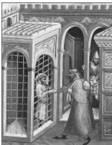
КАТОЛИЧЕСКАЯ ЦЕРКОВЬ. К. ди Камерино. Серия «Дела милосердия»: «Напоение жаждущих» и «Посещение узников». XIV в. Вероятно, из церкви Милосердия в Анконе (Италия)