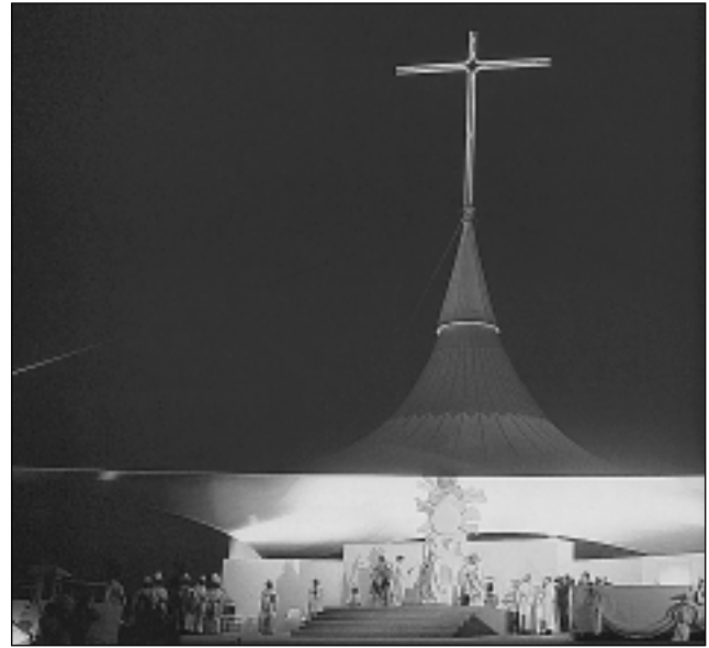
КАТОЛИЧЕСКАЯ ЦЕРКОВЬ. Слева: процессия в Сент-Анн-д'Оре (Франция); справа: месса во время визита в Лион Папы Иоанна Павла II в 1986

→Латеранским соглашениям удалось урегулировать положение К.Ц. в Риме: в 1929 было создано гос-во →Ватикан. Во время обеих мировых войн Римские папы выступали с мирными инициативами, выполняли функции посредников при переговорах, оказывали помощь пострадавшему гражданскому населению и военнопленным. Различные организации К.Ц. спасли от неминуемой смерти от рук нацистов ок. 800 тыс. лиц «неарийской» национальности и антифашистов. В частности, многим преследуемым лицам было предоставлено убежище в имеющих экстерриториальный статус зданиях Ватикана. Большое количество католических священников участвовало в движении Сопротивления. Совершая подвиги мужества и героизма, мн. священники, монахи и монахини погибли от рук нацистов, в т.ч. →Максимилиан Кольбе, →Тит Брандсма, →Эдита Штайн.