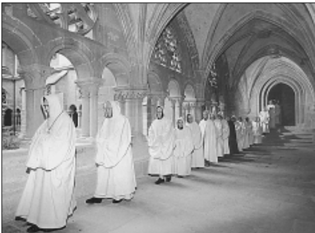
КАТОЛИЧЕСКАЯ ЦЕРКОВЬ. Монахи бенедиктинского Солемского аббатства

С сер. I в. существует христ. община Рима, основанная ап. Петром, который оставался ее епископом вплоть до своей мученической кончины во время →гонений на христиан со стороны имп. →Нерона; в Риме претер-