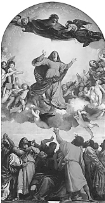
КАТОЛИЧЕСКАЯ ЦЕРКОВЬ. Тициан. Взятие на небо Пресв. Богородицы. 1516–18. Церковь Санта Мария Глорियोза деи Фрари, Венеция

Освящая мир, Церковь совершает богослужбные действия, важнейшими из которых являются таинства — видимые знаки невидимой благодати Божьей: →крещение, →миропомазание, →Евхаристия, →покаяние и примирение (→исповедь), →еleosвящение (еleosмазание больных), →священство и →брак. Каждое из таинств установил Сам Иисус Христос. Центр всей богослужбной жизни Церкви — таинство Евхаристии, в котором Иисус Христос присутствует телесным образом: хлеб и вино, не меняя своих видимых свойств, в то же время становятся Телом и Кровью Иисуса Христа; при этом в каждой частице хлеба и вина присутствует весь Иисус Христос.