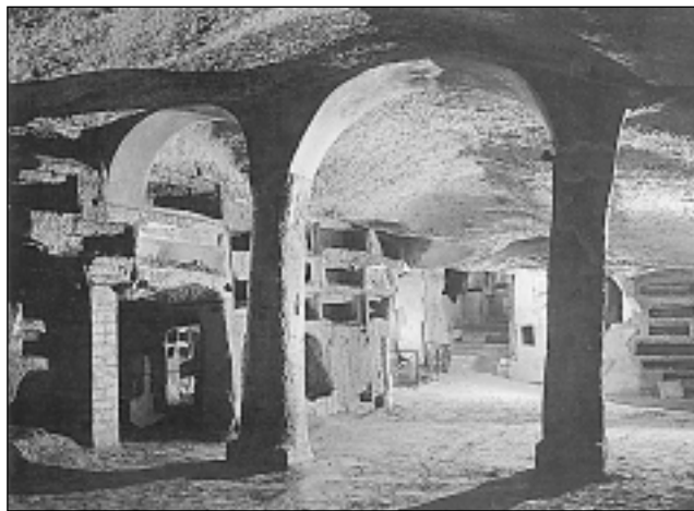
КАТОЛИЧЕСКАЯ ЦЕРКОВЬ. Катакомбы Св. Януария, Неаполь

Одновременно с ростом влияния христианства в империи усиливались организованные властями гонения на христиан. Последовательные репрессии были предприняты имп. →Децием в 250, а затем имп. →Диоклетианом в 303. Осн. причинами гонений были отвержение христианами языческих культов, в которых гос-во видело залог гражданской лояльности; распространенные в об-ве предрассудки в отношении христ. религии и нравов; активная проповедническая деятельность христиан.