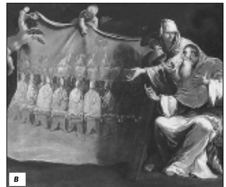
КАТОЛИЧЕСКАЯ ЦЕРКОВЬ: а) Ф. Бланшар. Первая месса на американском континенте. XIX в. Музей изящных искусств, Дижон (Франция); б) подписи кардиналов Мороне, Гозия, Симонетты, Наваджеро, а также Карла Лотарингского на решениях Тридентского собора (5 декабря 1563). Тайный архив Ватикана; в) С. Риччи. Папа Павел III обдумывает проект созыва Тридентского собора. XVIII в. Городской музей, Пьяченца (Италия)