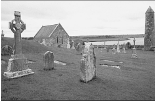
КАТОЛИЧЕСКАЯ ЦЕРКОВЬ. Ирландский монастырь Клонмакнойс, основанный в 545 (на переднем плане — «Крест Писания»)

совершавшие длительные путешествия, в ходе которых проповедовали христианство, в т.ч. в Великобритании и на континенте (одной из первых была миссия →Колумбана). В VII–IX вв. в результате деятельности миссионеров (→Аманда, →Бонифаций, →Виллиброрд, →Виллибальд, →Анскар и др.) были христианизированы Германия, Фландрия, Каринтия, Дания.