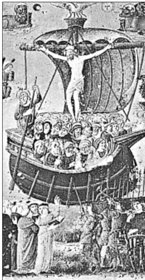
КАТОЛИЧЕСКАЯ ЦЕРКОВЬ. Изображение Церкви как корабля. Миниатюра XV в. в бревиарии из Ломбардии (Италия)

Мир, будучи творением абсолютно благого Бога, сам благ. Творение включает материальный мир и →ангелов — полностью дух. существ, посредников между Богом и материальным миром. Из всех творений особым сходством с Богом наделен человек, которому Бог дал во владение всю землю. Человек был сотворен для блаженной жизни в совершенном общении с Богом, однако первые люди злоупотребили своей свободой — нарушили запрет, данный Богом, и тем самым совершили первородный грех. Это произошло в результате →искушения со стороны →дьявола — ангела, отпавшего от Бога и ставшего Его врагом. Следствием первородного греха стали все страдания и несчастья, выпадающие на долю людей, включая неизбежность смерти. К первородному греху добавились и др. грехи, еще ухудшившие положение человека. От рабства греху человек не может спастись соб-