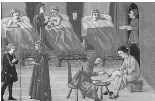
КАТОЛИЧЕСКАЯ ЦЕРКОВЬ. Лечение в госпитале. Миниатюра из рукописи XV в. Библиотека Св. Лаврентия, Флоренция

Важным вопросом, находящимся в центре внимания К.Ц., является также этика семейных отношений. К.Ц. благословляет и защищает брак, утверждает его свящ. характер и нерасторжимость (ср. Мк 10, 9). Назначение семьи — стать сооб-вом, осн. на бескорыстной любви и взаимном уважении. Отстаивая нерасторжимость брака, К.Ц. призывает женатых людей быть до конца верными слову, данному друг другу. Повторный брак католика (при живом первом супруге) не исключает его из Церкви, но не позволяет ему приступать к таинству Евхаристии: этот брак уже нельзя освятить в Церкви.