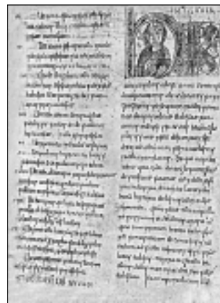
КАТОЛИЧЕСКАЯ ЦЕРКОВЬ. Страница «Церковной истории народа англос» Беды Достопочтенного. Манускрипт IX в. Гос. Публичная библиотека им. Салтыкова-Щедрина, С.-Петербург

В 1054 произошло взаимное анафематствование Константинопольского патр. →Михаила Керулария и папского легата →Гумберта Сильва-Кандидского, результатом чего стало разделение Церквей Востока и Запада. В дальнейшем за Зап. Церковью, сохранившей единство с Папой Римским, закрепилась