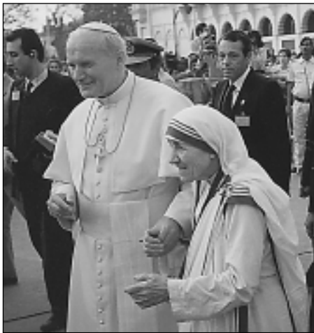
КАТОЛИЧЕСКАЯ ЦЕРКОВЬ. Папа Иоанн Павел II и основательница Конгрегации миссионерок Божественной любви мать Тереза Калькуттская. Индия, 1986

Помимо монашеских ин-тов в К.Ц. существуют т.н. секулярные ин-ты, отличающиеся от монашеских отсутствием совместной братской жизни, прежде всего потому, что их деятельность в Церкви требует не отречения от мира, как у монашествующих, а постоянного присутствия в миру. Кроме того, в К.Ц. существуют об-ва апост. жизни, члены которых, как правило, не приносят обетов, выражая принятие на себя уз целомудрия, бедности и послушания в к.-л. др. форме (одно из самых известных — Об-во →сализианцев, осн. в XIX в. →Иоанном Боско).