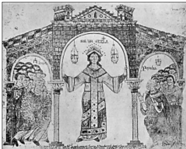
КАТОЛИЧЕСКАЯ ЦЕРКОВЬ. Матерь Церковь. Миниатюра кодекса из монастыря Монтекассино. Кон. XI в. Ватиканская библиотека

Согласно католической вере, мир создан всемогущим Богом, Который безраздельно управляет им по Божественному Провидению. Бог настолько превосходит творение, что Его сущность остается тайной для человека. Бог всеведущ, вечен, всеведущ, абсолютно справедлив и в то же время бесконечно милосерден: Бог есть любовь. Он един в трех Лицах (→ипостасях), называемых Отцом, Сыном и Св. Духом (→Троица). Лица Троицы единодушно участвуют в каждом действии Бога вовне ( ad extra ). Они отличаются отношениями друг к другу: Отец рождает Сына, Св. Дух исходит от Отца и Сына; при этом Отец является источником всей Троицы, единственным началом