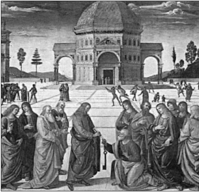
КАТОЛИЧЕСКАЯ ЦЕРКОВЬ. Слева: Перуджино. Передача ключей апостолу Петру. 1480–81. Фреска Сикстинской капеллы, Ватикан; справа: А. Бонаюти. Схождение Св. Духа на апостолов. Фреска XIV в. Церковь Санта Мария Новелла, Флоренция