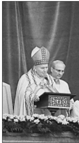
ИОАНН ПАВЕЛ II. Рождественское послание Папы « Urbi et orbi » — «Городу и миру». Рим, 25 декабря 1999

В философии об-ва ключевым понятием для И. является communio personarum (общение, взаимная причастность личностей), выражающее такой образ личн. сосуществования, при котором принцип их единства основывается на взаимном признании достоинства членов общности. Осн. принцип, объединяющий разные формы communio personarum , — любовь-дар. Особо важными являются брак и семья, представляющие собой первостепенную и наиболее простую форму общины.