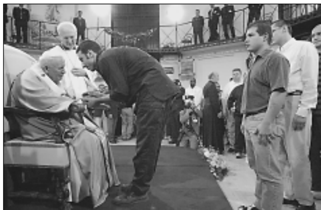
ИОАНН ПАВЕЛ II. Посещение римской тюрьмы Реджина Чели. 9 июля 2000.

Выражая поддержку населению бедных и слаборазвитых стран в борьбе за социальную справедливость, И. в то же время подверг критике положения →теологии освобождения, подчеркивая, что борьба против несправедливости и различных видов социального и полит. подавления должна сохранять дух. приоритеты и пониматься как основанное на этических критериях движение, вдохновляемое Евангелием, а не как неизбежный продукт классовых конфликтов, интерпретируемых в марксистских категориях ист. развития.