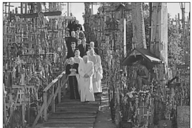
ИОАНН ПАВЕЛ II. Гора Крестов в Шяуляе (Литва). 7 сентября 1993.

Науч. и пастырское наследие И. собирает и обрабатывает Центр документации понтификата в Риме; изучением его идей и деятельности занимается специально открытый в 1982 при Люблинском католическом ун-те междунар. Институт Иоанна Павла II.