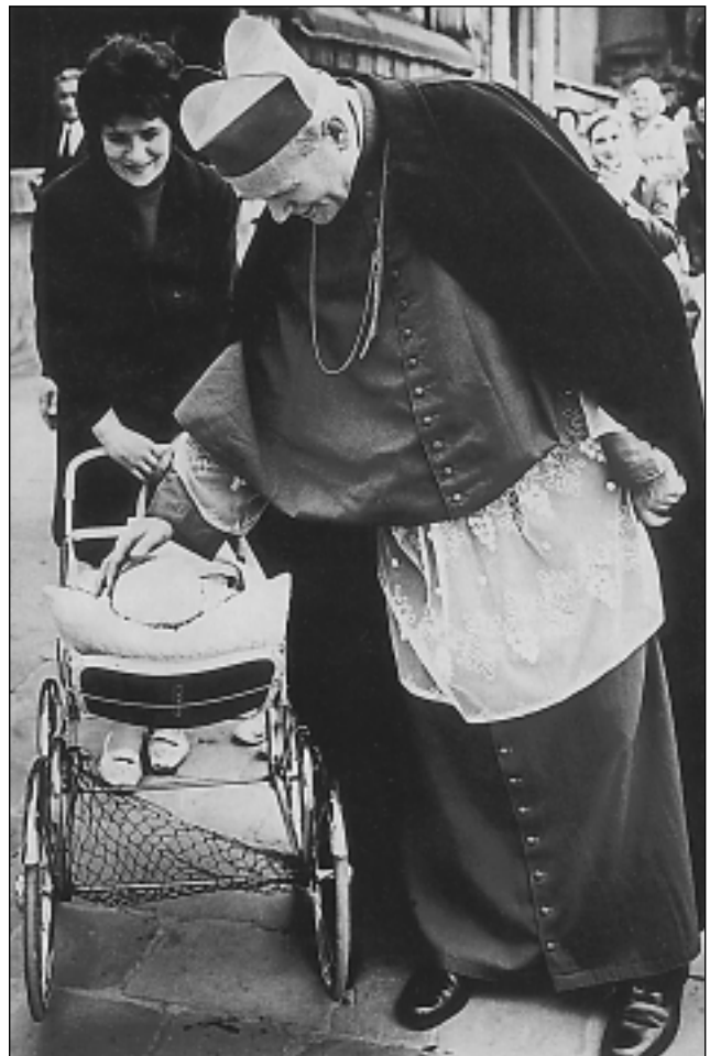
ИОАНН ПАВЕЛ II. Кардинал Кароль Войтыла

Считая экуменизм путем единения христиан и знамением времени, И. предпринял ряд шагов по преодолению доктринальных разногласий между Католической Церковью и др. христ. Церквями и общинами. В результате были подписаны совместные декларации с правосл. патр. Антиохийским Игнатием Зака