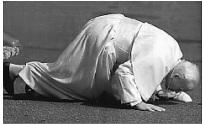
ИОАНН ПАВЕЛ II. Прибывая с визитом в страну, Папа целует землю в знак уважения к народу этой страны

В числе апост. посланий следует выделить: → Egregiae virtutis (31.12.1980); → Salvifici doloris (11.02.1984) — о христ.