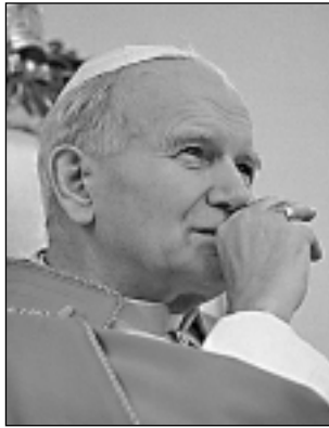
Папа ИОАНН ПАВЕЛ II

humanae . После окончания собора К. Войтыла подготовил архиепарх. синод в Кракове (1972) для осуществления программы реформ в русле →аджорнаменто и лично написал коммент. к соборным документам. Со временем возростала роль кард. К. Войтылы в Католической Церкви на междунар. уровне: он участвовал в ген. ассамблеях синодов епископов 1969, 1971, 1974 и 1976, в Евхарист. конгрессе в Филадельфии в 1976, выступал с лекциями в различных ун-тах мира.