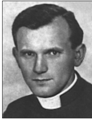
ИОАНН ПАВЕЛ II. Кароль Войтыла (фотографии разных лет)

катол. вероучения относительно ценности и неприкосновенности человек. жизни с момента зачатия до естественной смерти И. подтвердил в энц. → Evangelium vitae (25.03.1995).