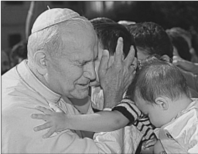
ИОАНН ПАВЕЛ II приветствует детей.

шествование всеобщих и неизменных нравственных норм, стоящих на страже неприкосновенного достоинства человек. жизни.