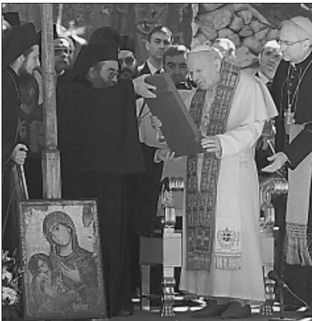
Иоанн Павел II в монастыре Св. Екатерины на горе Синай. 26 февраля 2000.

Отношения с СССР и Россией. Становлению особо внимательного отношения к России способствовало глубокое изучение Папой работ таких рус. рел. философов и богословов, как В. →Соловьёв, Н. →Бердяев, о. С. →Булгаков, С. →Франк. Личные встречи И. со многими рус. культ. и полит. деятелями способствовали укреплению глубокой убежденности Папы в том, что рел. основы рус. культуры содержат огромный потенциал для разви-